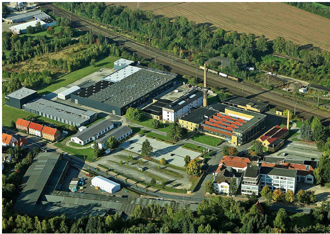
Das FAGUS-WERK in Alfeld